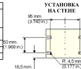
УСТАНОВКА НА СТЕНЕ